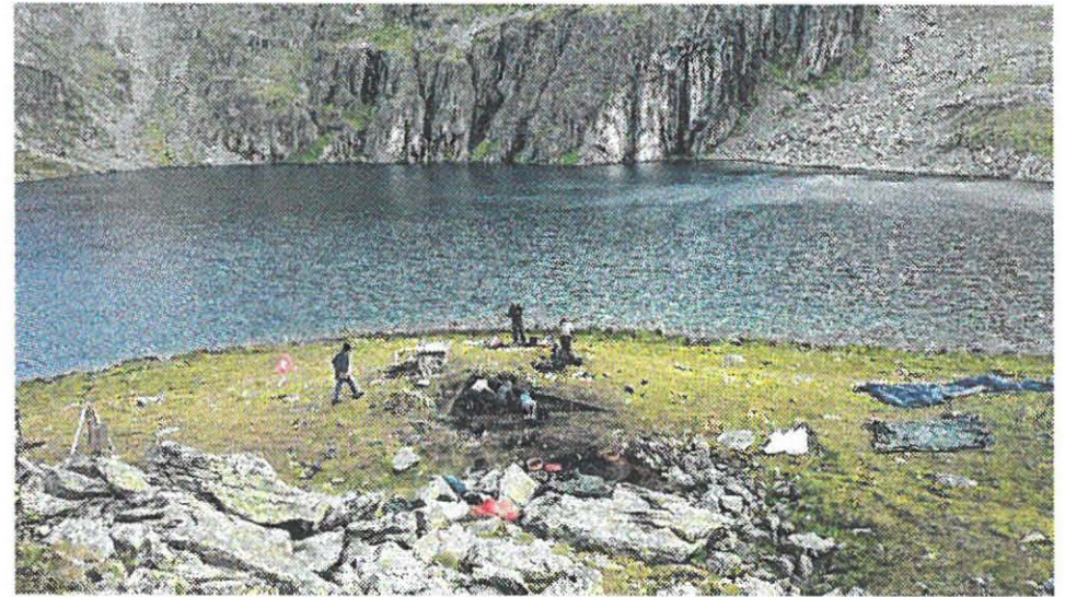
Das archäologische Team war heuer am Alkuser See besonders erfolgreich.

Als Opferplatz vermutete Strukturen haben sich als solcher bestätigt. „Dass hier kultische Rituale ausgeführt wurden, ist absolut sicher“, stellt Stadler klar. „Alle Kriterien sind erfüllt.“ Man fand viel Holzkohle, verbrannte Tierknochen, Schmuckstücke und Bergkristalle sowie römische und bronzezeitliche