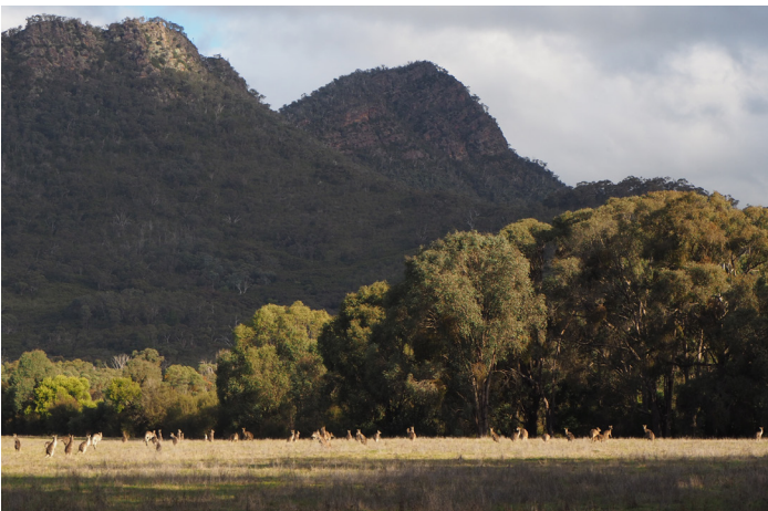
Kängurus beim Sonnenuntergang