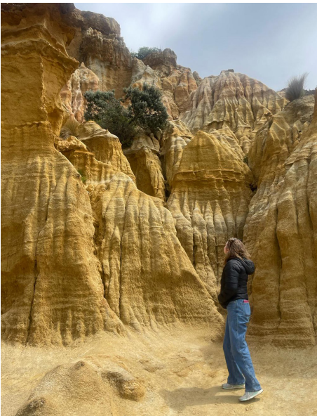
Marslandschaft bei Half Moon Bay