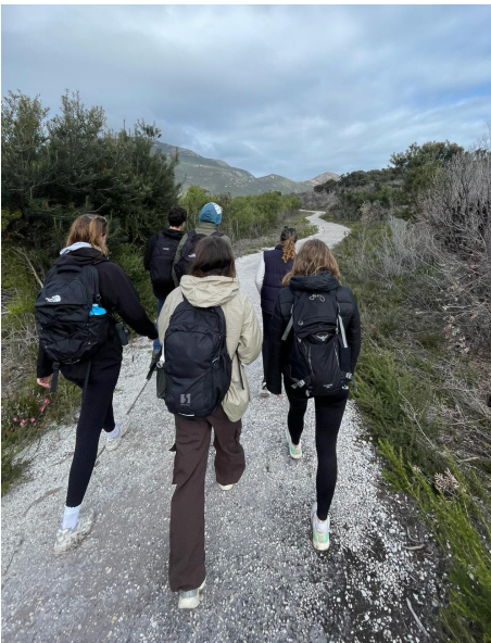
Wandern bei Wilson's Prom