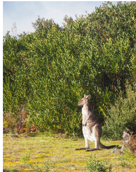
Kleines Känguru bei Wilson's Prom