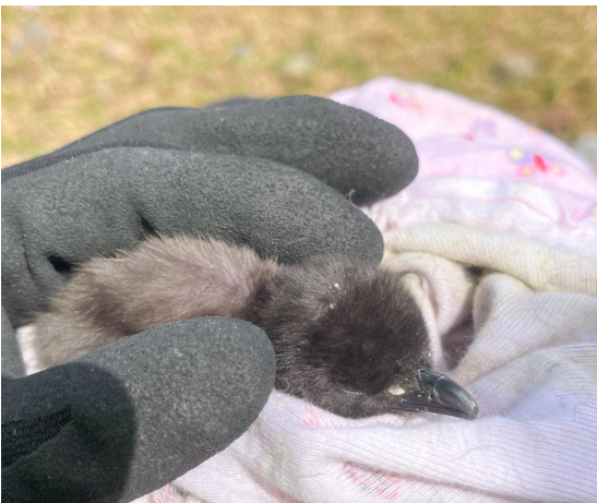
Ein normaler Tag bei Earth Care St. Kilda