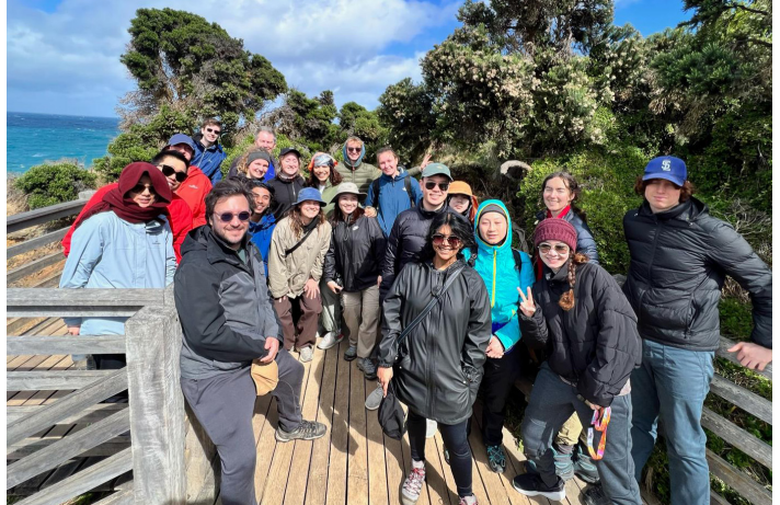
Ausflug mit dem RMIT Outdoors Club