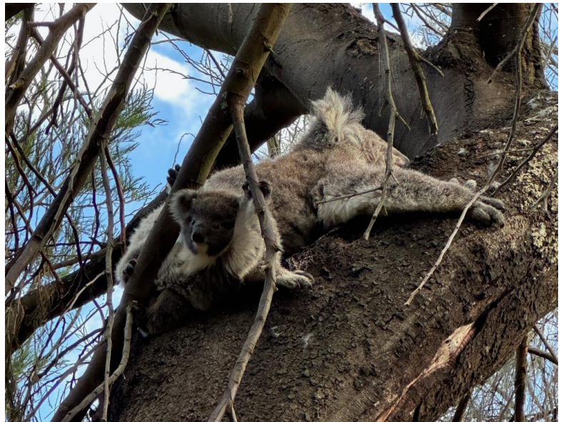
Koalas - Tower Hill Wildlife Reserve