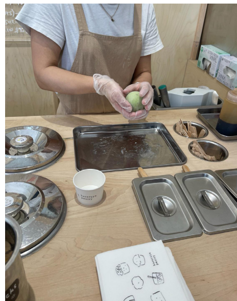
Handgemachte Mochi - Hareyuya Pantry