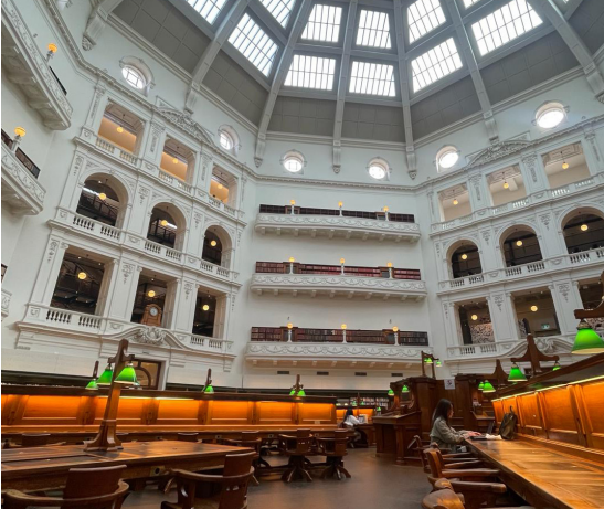
Mein Lieblingsplatz zum Lernen - State Library Victoria

Meine gesamte Zeit in Australien nur in ein paar Worte zu fassen ist eine Herausforderung. Sogar ein ganzes Buch würde nicht genug Seiten haben, um meine Dankbarkeit auszudrücken, an diesem einzigartigen Auslandssemester teilgenommen zu haben. Deshalb möchte ich dir noch diesen letzten Gedanken mit auf den Weg geben. Ich wünsche, ich hätte mehr Zeit in Australien gehabt. Ich würde bei der nächsten Gelegenheit sofort zurück fliegen und hoffe von tiefstem Herzen, dass du diese Chance wahrnimmst und dass deine Zeit in Australien genau so schön sein wird wie meine.