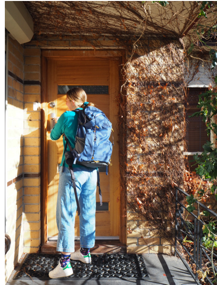
Meine Mitbewohnerin & unsere Haustür