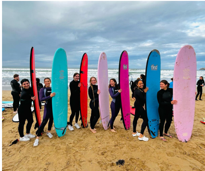
Ausflug mit dem RMIT Surf Club - Ocean Grove