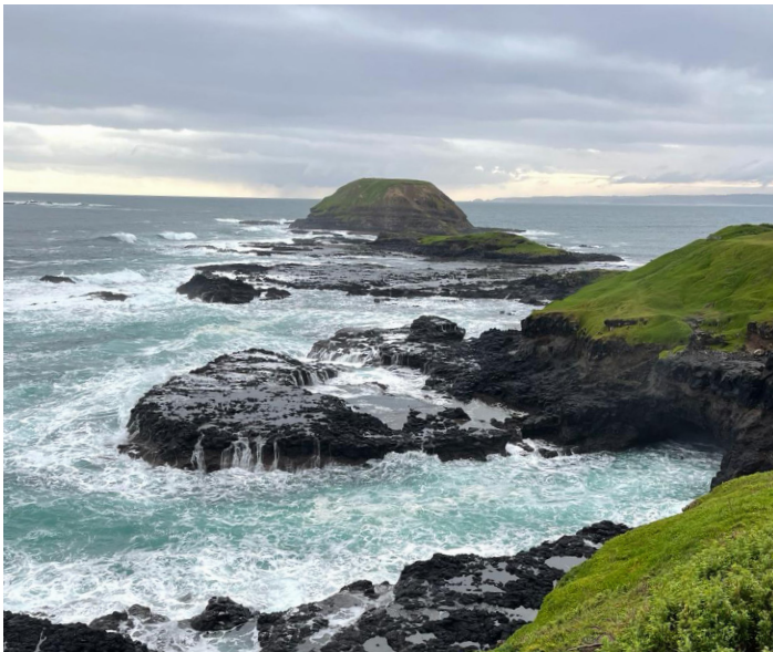
Phillip Island - The Nobbies