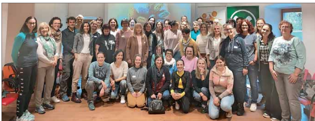
Rund 50 Interessierte nahmen an der Elki-Herbsttagung teil.

SOZIALES: Herbsttagung im Haus Thalhofer in Brixen – Sprachrohr für Familien